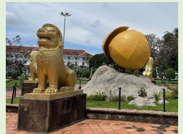
ロムドゥオルの モニュメント