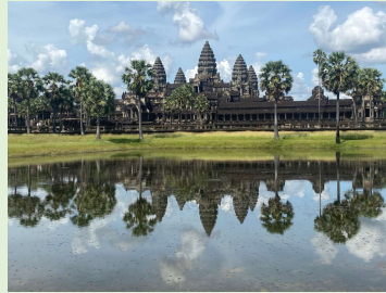
アンコールワット