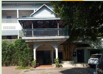
KAMPU JHC CO.,LTD (マンホールカード 配布場所)