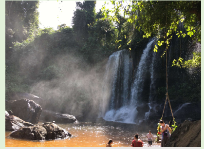
クーレン山 (水源地)