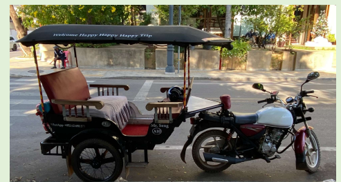
お勧めの乗り物: トゥクトゥク (カンボジア版タクシー)

※所要時間は、繁華街のパブストリートを起点に、トゥクトゥクで移動した想定で計算しています。