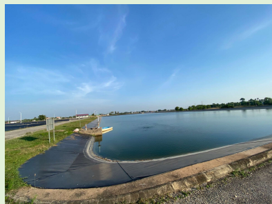
シェムリアップ 下水処理場 (1日流量8000m 3 )