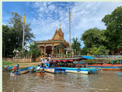
トンレサップ湖 (東南アジア最大の湖)