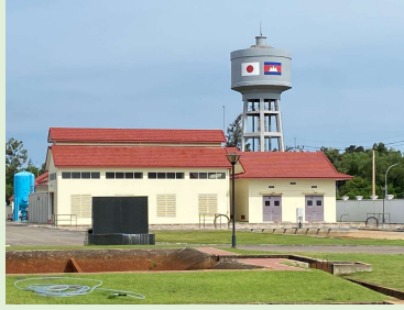
シェムリアップ 浄水場 (入場不可)